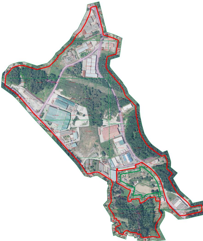
POLÍGONO INDUSTRIAL DE A LOMBA AREAS - PONTEAREAS - RIBADETEA VISTA AÉREA SIOTUGA