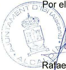
Rafael Serralta Vilaplana