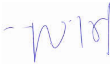
Fdo.: Julio López Revuelta