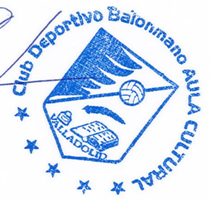
Cayetano Cifuentes Junquera