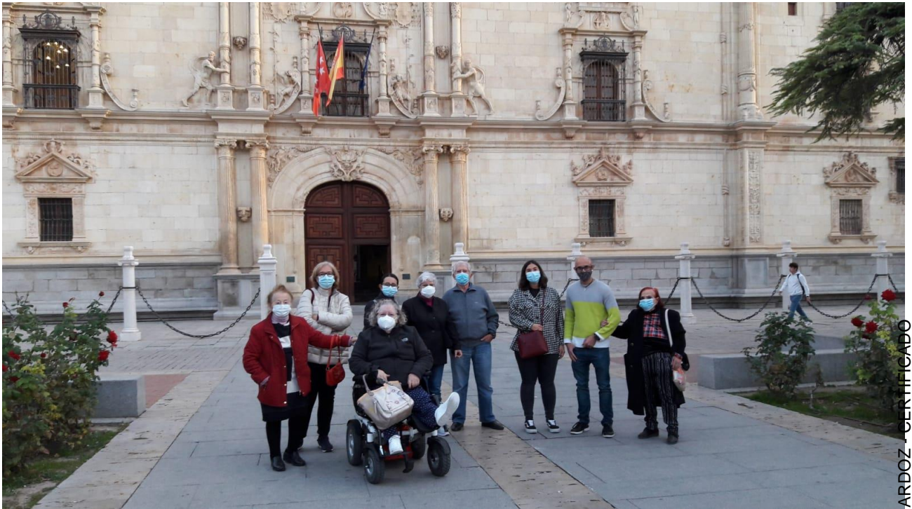
Torrejón de Ardoz

C/ Embajadores 206 Duplicado, 1ºC - 28045 MADRID Tel/Fax. (34) 91 359 93 05 info@amigosdelosmayores.org || http://www.amigosdelosmayores.org