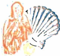
Cofradía del Santo