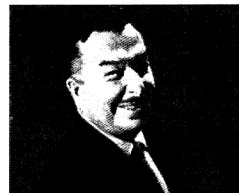
Xavier Cugat. Girona