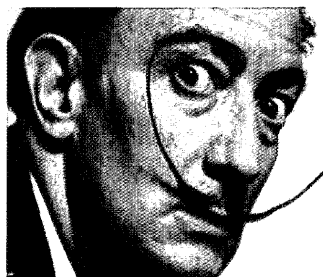
Salvador Dalí. Figueres