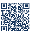
Figura en el expediente documento RC que acredita la existencia de crédito retenido y disponible, doc. CSV: AEAA WWHW YYWQ RM9A YWH4; así como Informes de Fiscalización, ambos de fecha 26 de enero de 2022, documentos CSV: AEAA

Las presentes Bases reguladoras y convocatoria, una vez aprobadas por la Junta de Gobierno Local se publicarán en la página web del Ayuntamiento, en el tablón electrónico del Ayuntamiento y un extracto en el Boletín Oficial de la Provincia de Albacete a través de la Base de Datos Nacional de Subvenciones.