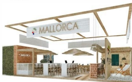
FERIA TIPO B