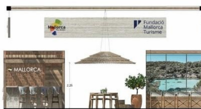
SECCIÓN FERIA TIPO B ESCALA 1/75