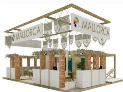
FERIA TIPO A

ADAPTACIÓN DE LA TECNOLOGÍA PARA INTENSIFICAR EL MENSAJE Y LA EXPERIENCIA SENSORIAL LED inteligentes de imitación de luz solar con espectro regulable Uso de la realidad virtual para una inmersión total