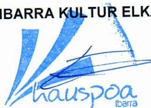
Eusebio Uberetagoena Arratibel