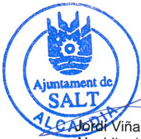
Jordi Viñas i Xifra Alcaldia de Salt

Ambdues parts accepten totes les clàusules d'aquest document i, en senyal de conformitat, el lliuren i el signen en el lloc i la data que s'indiquen al principi d'aquest document.