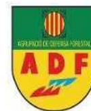
ADF Pla de Bages