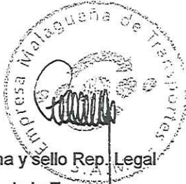
Firma y sello Rep. Legal de la Empresa