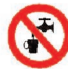
Agua no potable

Aquesta senyalització consisteix en un pictograma amb una aixeta negra sobre fons blanc, vores i banda (transversal descendent d'esquerra a dreta travessant el pictograma a 45° respecte a l'horitzontal) vermelles -el vermell ha de cobrir com a mínim el 35% de la superfície del senyal-. Aquest rètol ha d'estar en llocs fàcilment visibles en tots els casos.