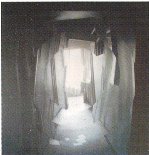
Funhouse Mónica Dixon