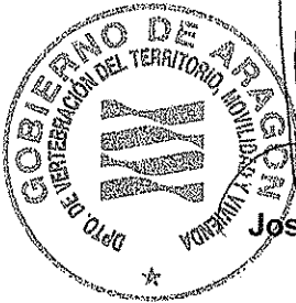
José Luis Soro Domingo

EL CONSEJERO DE VERTEBRACIÓN DEL TERRITORIO, MOVILIDAD Y VIVIENDA