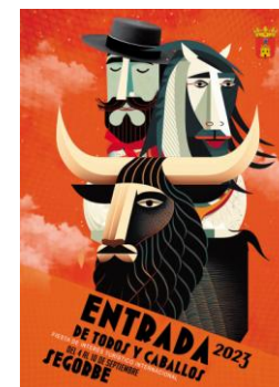
- Categoría Internacional - Accésit, 2023