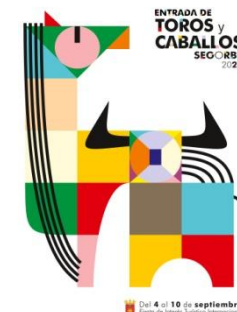
Categoría Internacional 1º Premio, 2023