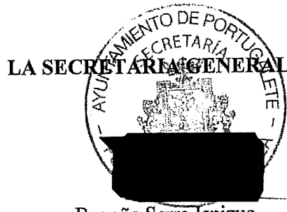
Begoña Serra Ispizua