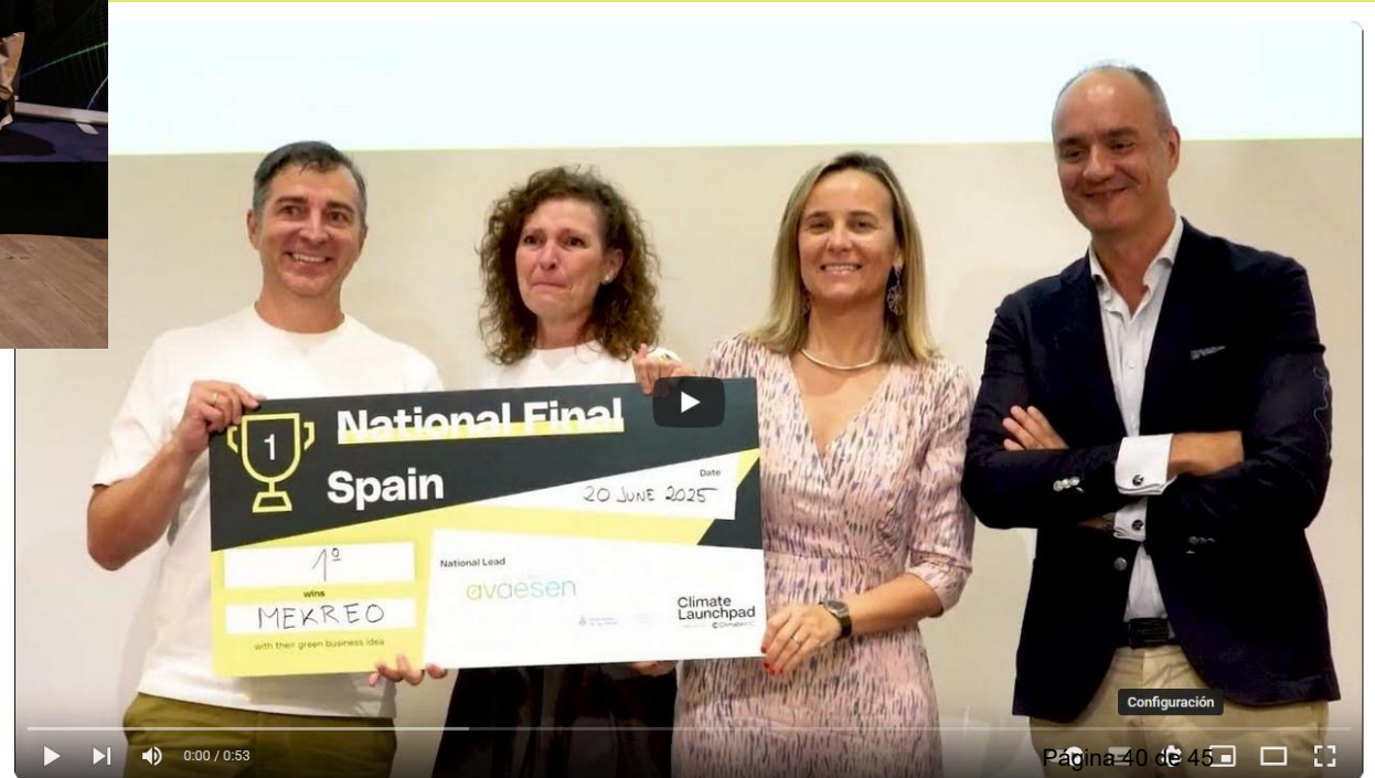
Vídeo resumen de la final nacional de ClimateLaunchpad 2025