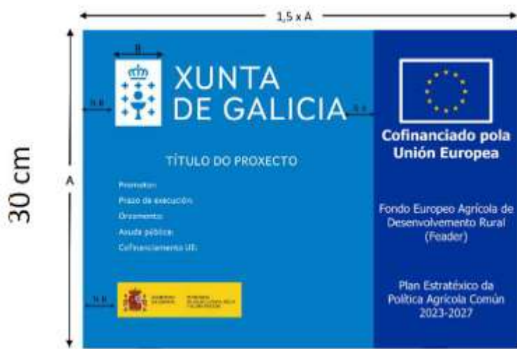
d) Adhesivos o etiquetas.