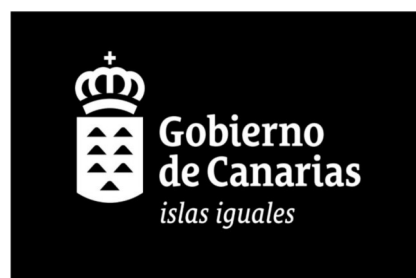
Modelo 1 negativo

El beneficiario podrá descargarse este modelo de logotipos en el Manual de la Identidad Gráfica del Gobierno de Canarias, en la siguiente dirección: